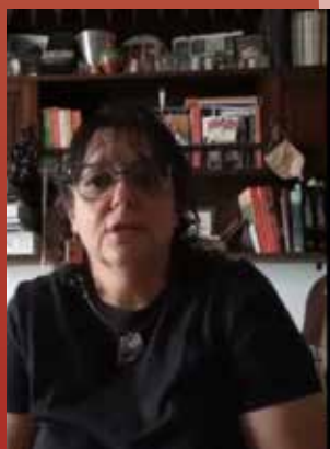
De Fogón en Fogón

Documental sobre la vida y el exilio del músico Alfredo Zitarrosa.