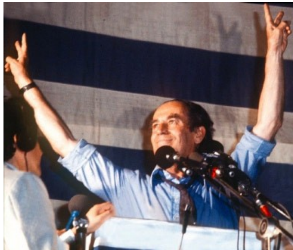
Wilson Ferreira Aldunate en la explanada municipal el 1° de diciembre de 1984, luego de su liberación

A 30 AÑOS DE LA MUERTE DE WILSON FERREIRA ALDUNATE